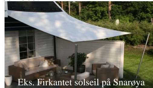
Eks. Firkantet solseil på Snarøya

Om festet plasseres utenfor den diagonale streken, strekkes seilet skjevt og kan ikke strammes opp.